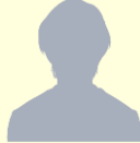
福岡本社 2022年4月入社

未経験からのチャレンジでしたが、周囲の方にアドバイスをもらいながら経験を積み知識を構築してきました。資格支援制度もあり、自己学習環境も整っているなので、早くスキルアップを目指したい方にはお勧めです!公私の区別をしっかりとつけることが出来るので、仕事で頑張った分プライベートも充実させることができ、メリハリのある日々を過ごせています。